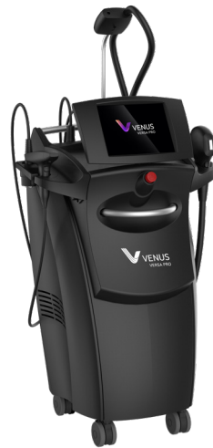
Der innovative Venus Versa™ Pro Laser kombiniert IPL, NanoFractional Radiofrequenz und Skin Resurfacing.

Ein entscheidender Vorteil der Behandlung mit dem Venus Versa™ Pro ist ihre Alltagstauglichkeit. Die Anwendung ist durch die NanoFractional Radiofrequenz-Technologie schonend und so konzipiert, dass sie sich gut in einen vollen Terminkalender integrieren lässt. Nach der Behandlung kann die Haut leicht gerötet sein, wirkt aber oft schon kurz danach frischer und revitalisiert. In den darauffolgenden Tagen zeigt sich die Haut zunehmend glatter, feiner und gleichmäßiger. So ist keine lange Ausfallzeit notwendig, die Behandlung kann ganzjährig durchgeführt werden, und moderne High-Tech-Ästhetik wird zu einem unkomplizierten Bestandteil der persönlichen Beauty-Routine.