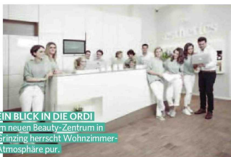
EIN BLICK IN DIE ORDI Im neuen Beauty-Zentrum in Grinzing herrscht Wohnzimmer-Atmosphäre pur.